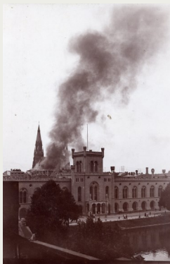
Brand bei Perzina im Jahre 1904