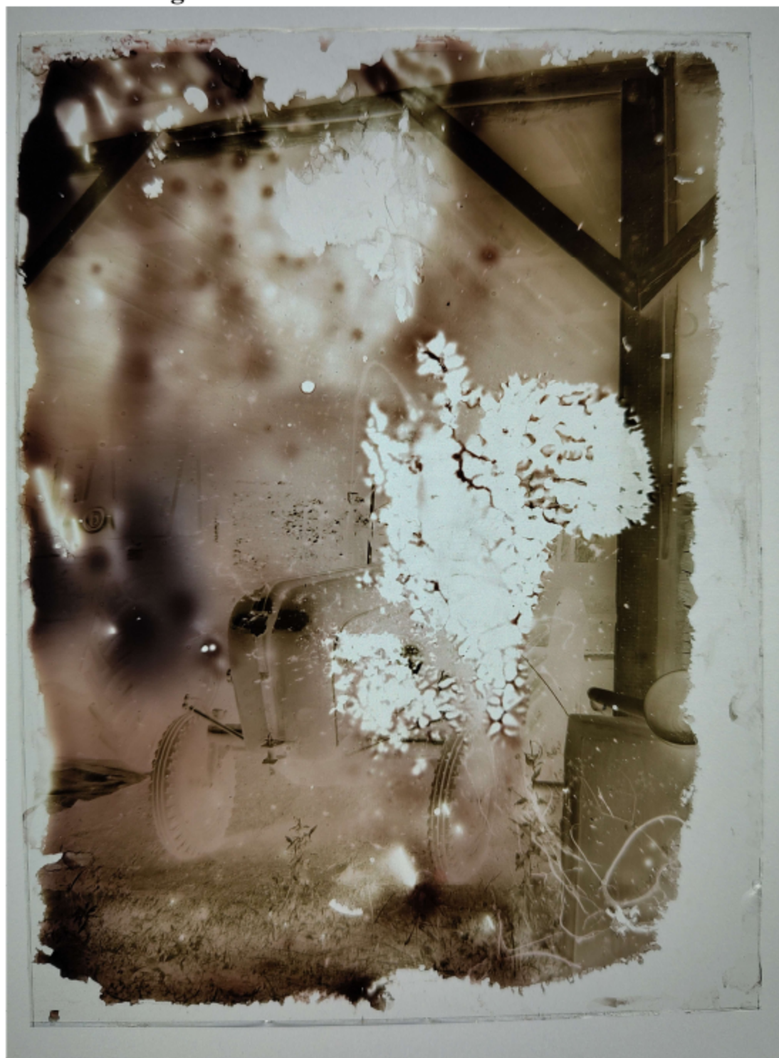
Abbildung 1 Traktor im Unterstand