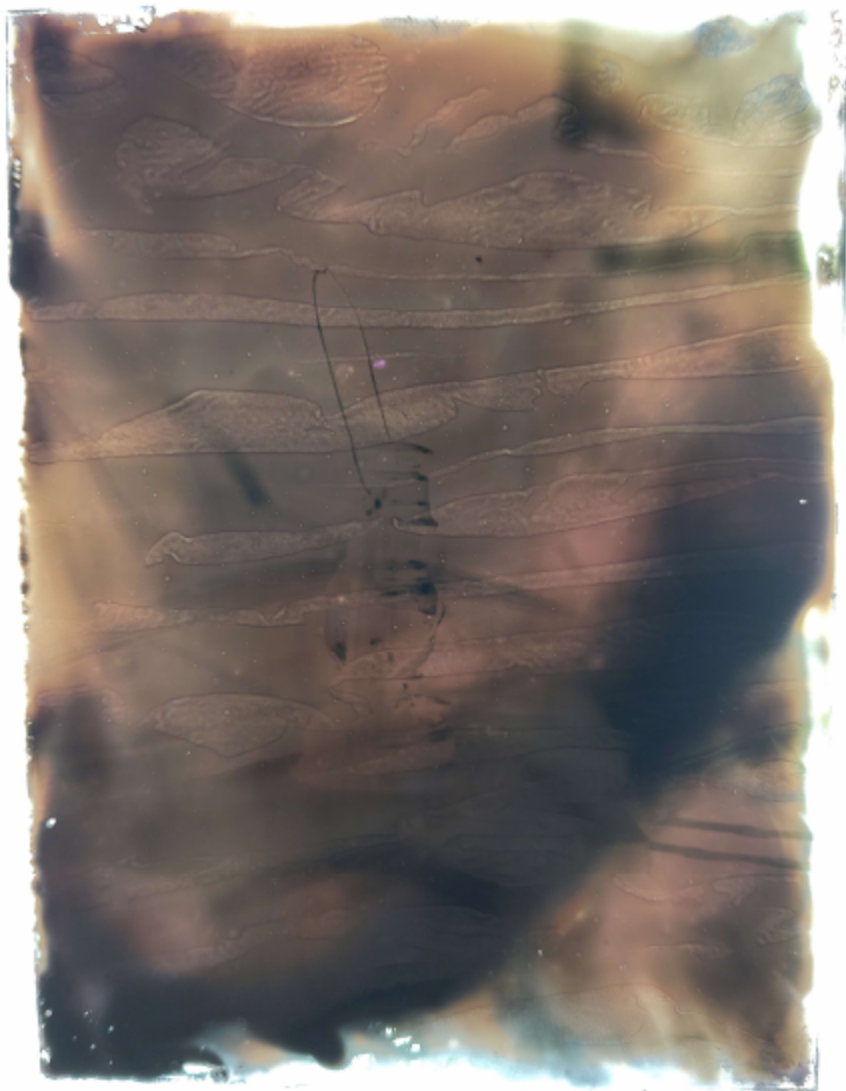
Abbildung 3 Laterne