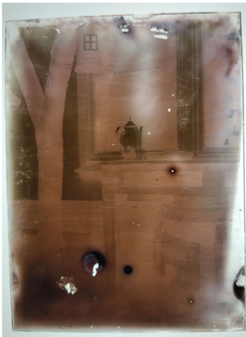
Abbildung 2 Teegedeck