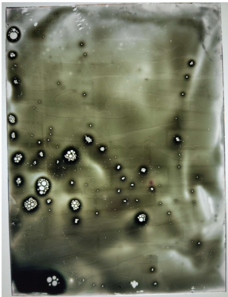
Abbildung 4 Mauer